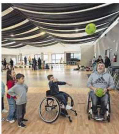
Circuito deportivo adaptado de Un Paso Máis.

Mañana, estarán en el CEIP Plurilingüe Nétoma-Razo y el jueves, en el CEIP Xesús San Luis Romero. Además, en Un Paso Máis ya han confirmado nuevos destinos para el 2025, como el CPI Plurilingüe Cabo da Area de Laxe o el CEIP Alfredo Brañas de Paiosaco. Ambas, en el mes de abril.