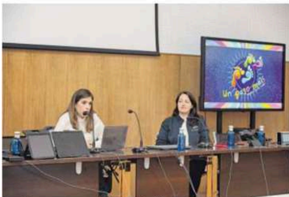
Dos de las ponentes en el Fórum carballés. BASILIO BELLO

docentes» representantes de 28 centros, algunos de fuera de la provincia. También participaron en este taller «moitas familias, que mostraron un gran interese en aprender sobre as ferramentas e técnicas de comunicación que se abordaron durante o taller. A variedade de participantes creou un ambiente dinámico e de colaboración, que sen dúbida enriqueceu a experiencia de todos», según indicaron desde Un Paso Máis.