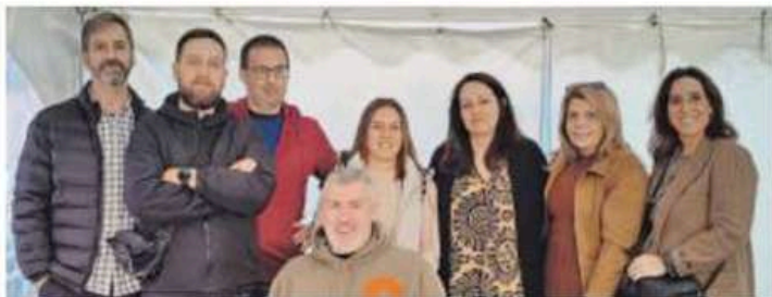
Se celebraron elecciones y una posterior asamblea.