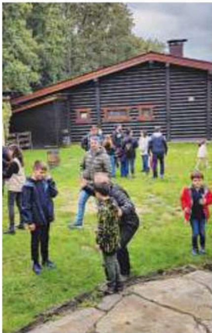
Salida a Marcelle Natureza.

E chegou o día de Marcelle, onde os nosos pequenos desfrutaron coma nunca.