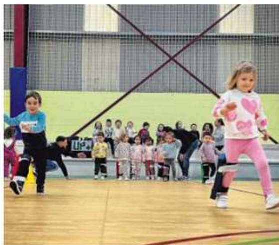
Dos alumnos del A Gándara en uno de los circuitos inclusivos.

+ 1500 escolares que disfrutarán e aprenderán do deporte adaptado con Un Paso Máis